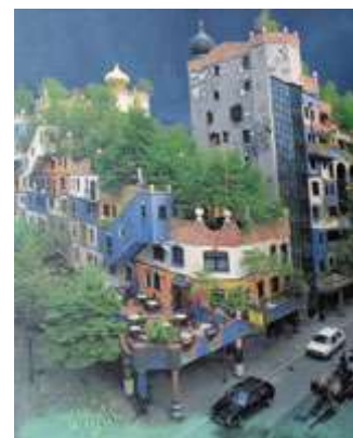
Το όραμα του Hundertwasser για πράσινες οροφές

«Παρά τις αντιρρήσεις, πρέπει η ζωή να συνεχίσει να προχωράει και να προσπαθούμε να κάνουμε τον κόσμο καλύτερο».