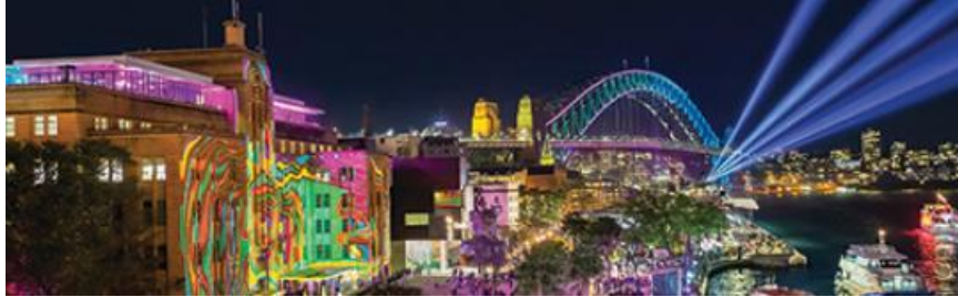
Vivid Sydney Timelapse