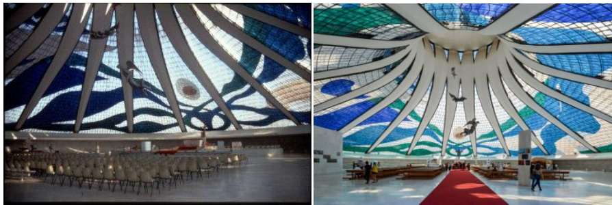
Catedral Metropolitana: The Metropolitan Cathedral of Brasilia by architect Oscar Niemeyer

«Η πλαστικότητα και η ποικιλοχρωμία των τοπίων της Βραζιλίας, ένα κλίμα που απαιτεί τη μικρότερη δυνατή τεχνολογική βοήθεια, ένας τρόπος ζωής που βασίζεται στο παρών περισσότερο από ότι στη διαφορούμενη ροή του γίνεσθαι κι ένας λαός με πλούσια συναισθήματα στην εξωτερίκευση τους γίνονται ποίηση λυρική ενώ στην εσωτερίκευση τους κάμπτονται προς τα αρχέτυπα. Αυτά ίσως εξηγούν κάποια δεδομένα της ακμής της νέας Βραζιλιάνικης αρχιτεκτονικής.»