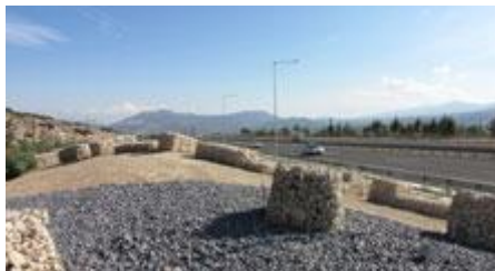
Τοπίο εντοπισμού/σήμανσης του αρχαίου λατομείου Κλεωνών Γλυπτά Αρχιτεκτονικά Τοπία - Α. Κουζούπη, Ν. Γκόλαντα _ 2011