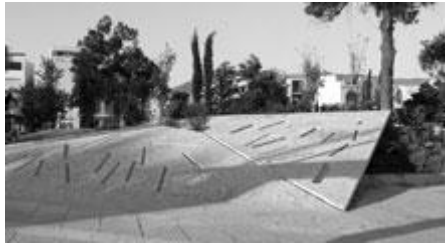
Πλατεία Κατράκη Γλυπτά Αρχιτεκτονικά Τοπία - Α. Κουζούπη, Ν. Γκόλαντα _ 2008