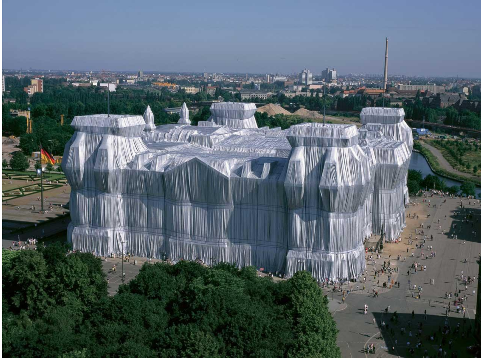
Christo and Jeanne Claude – Wrapped Reichstag 1995