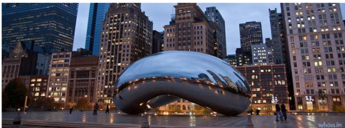
Anish Kapoor – Cloud Gate – Chicago 2006

https://www.publicartfund.org/videos_etc