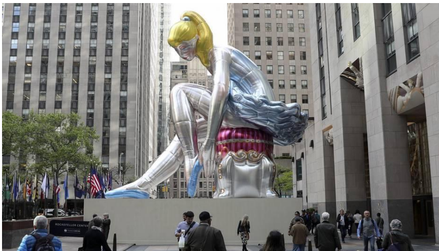
Jeff Koons - New York – Ballerina 2017