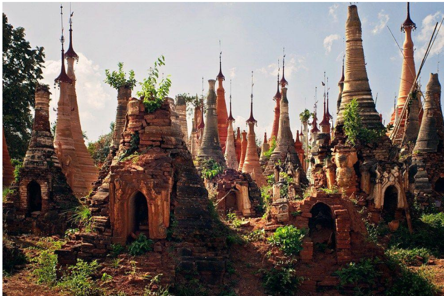
Μιανμάρ -επαρχία Shan - Δίπλα στη λίμνη Inle.