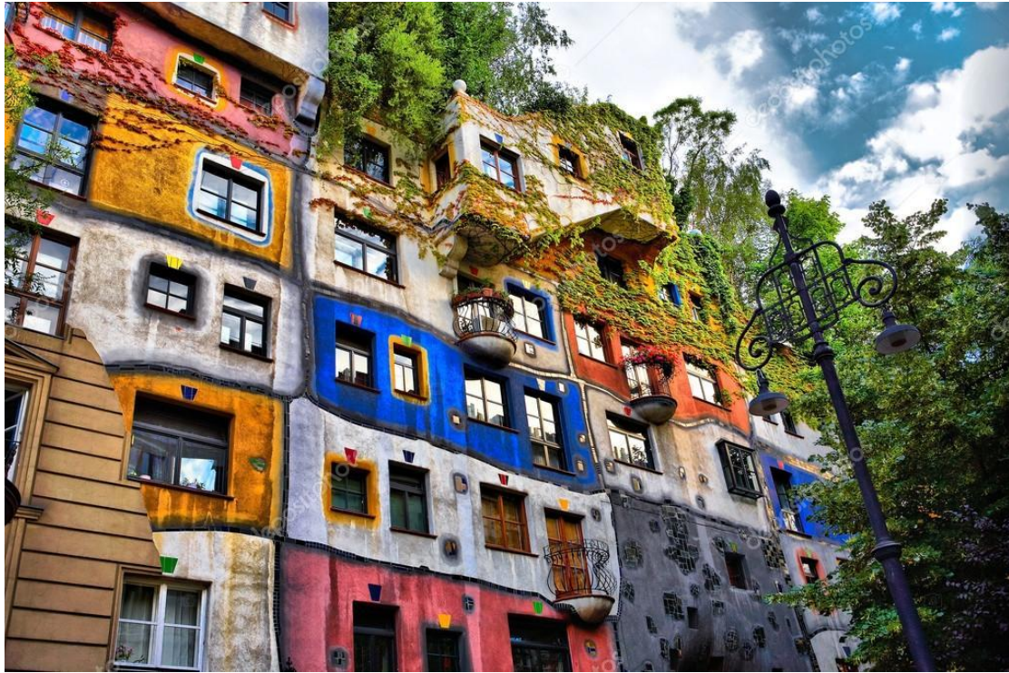
Το σπίτι του Χουντερτβάσερ στη Βιέννη, Αυστρία