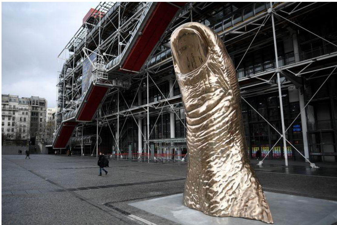
Cesar Baldaccini, Le pouce - Centre Pompidou – Paris