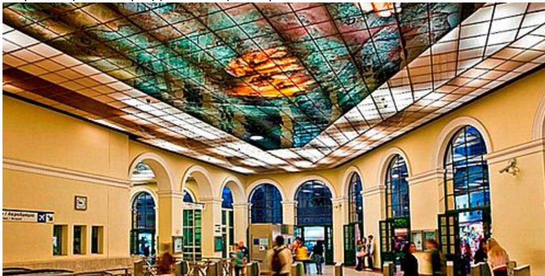
στ. Μοναστηράκι «Ο κόσμος στα χέρια μου» Λ. Παπακωνσταντίνου