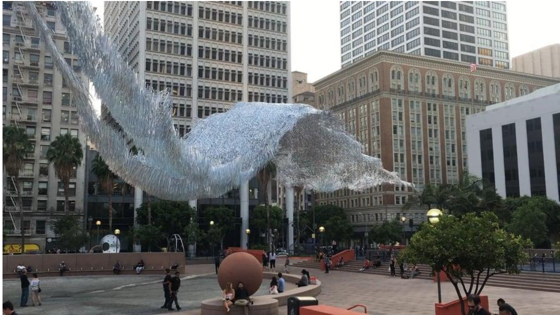
Floating sculptures - installation in St. Petersburg, Russia 2016