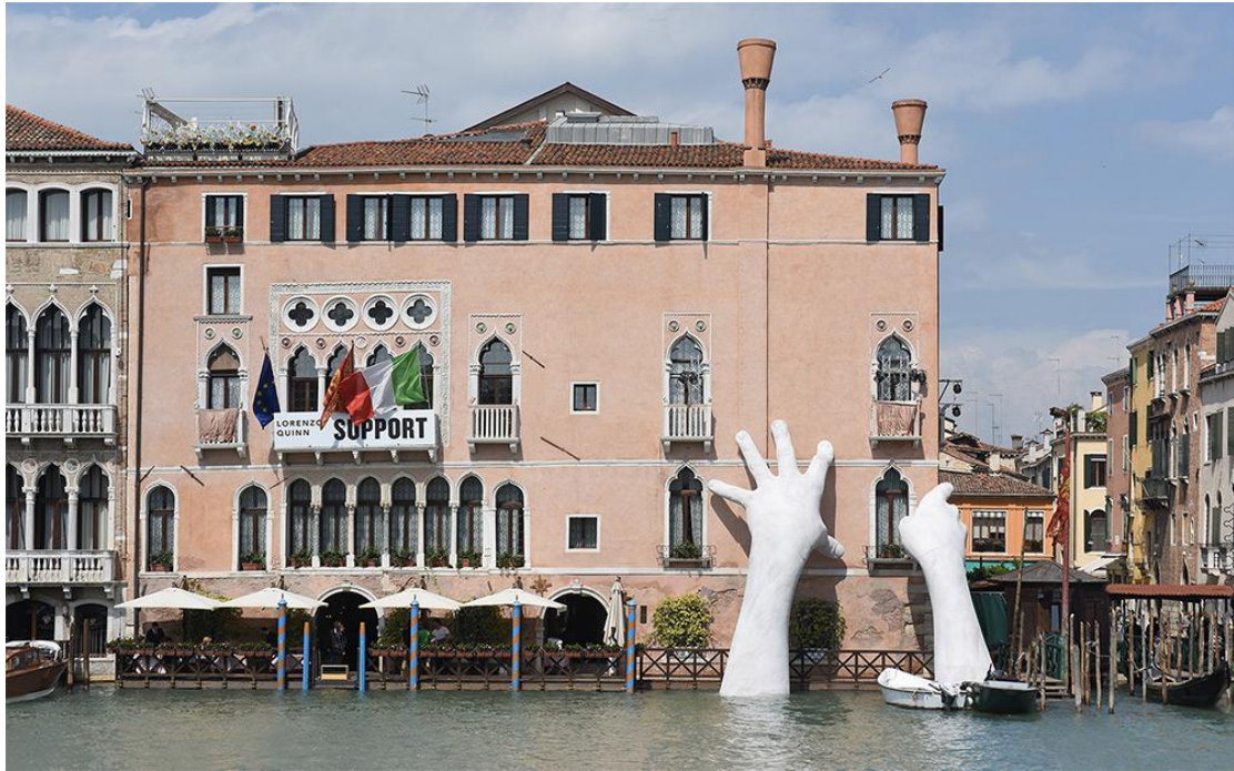
Artist Lorenzo Quinn 2017 Venice Biennale.