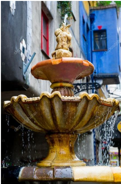
Κρήνη στο σπίτι του Χουντερτβάσερ.