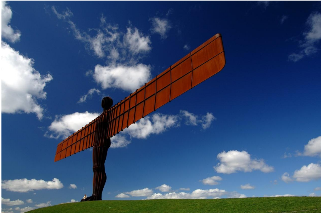
Angel of the North (1998) - Antony Gormley – Gateshead - England.