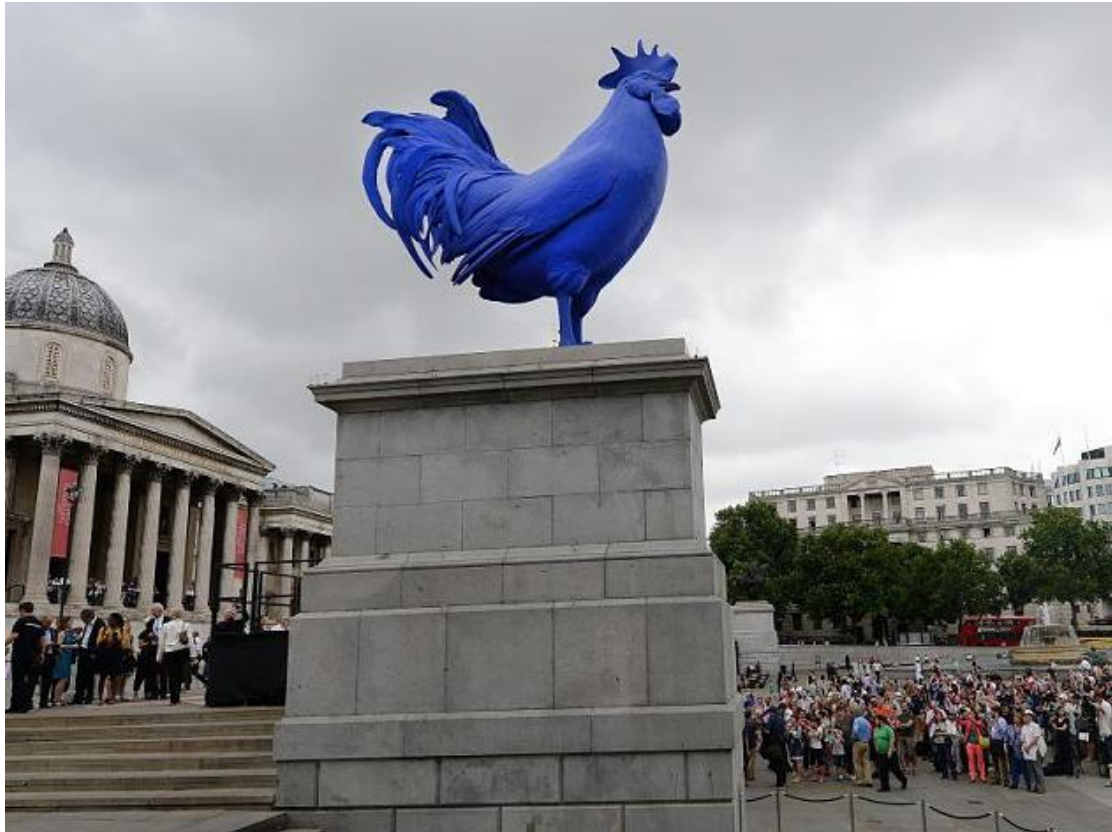
Created by Katharina Fritsch, 'Hahn/Cock'

«Η τέχνη δεν είναι για λίγους και χαιρόμαι που είναι τόσο έντονες οι αντιδράσεις του κοινού» δήλωσε η καλλιτέχνιδα.