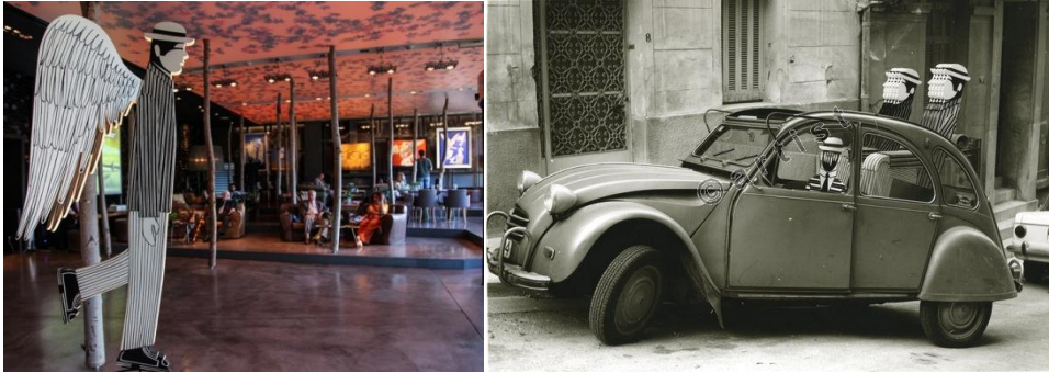
Γιάννης Γαϊτς, Χωρίς τίτλο, 1977, εγκατάσταση, κατασκευή από ζωγραφισμένο ξύλο