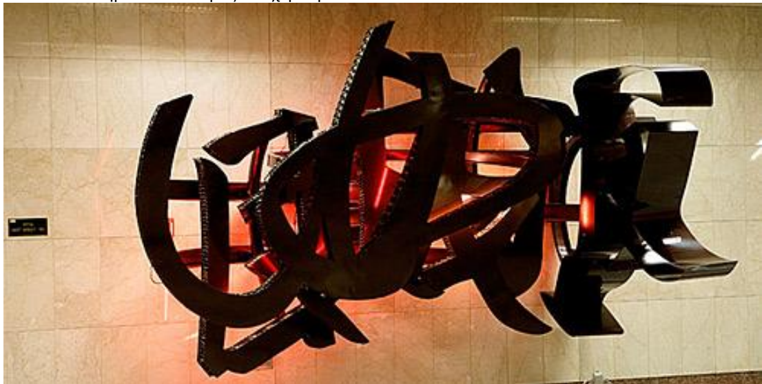
Στ. Ευαγγελισμός «Mott Street» Καλλιτέχνης: Χρύσα