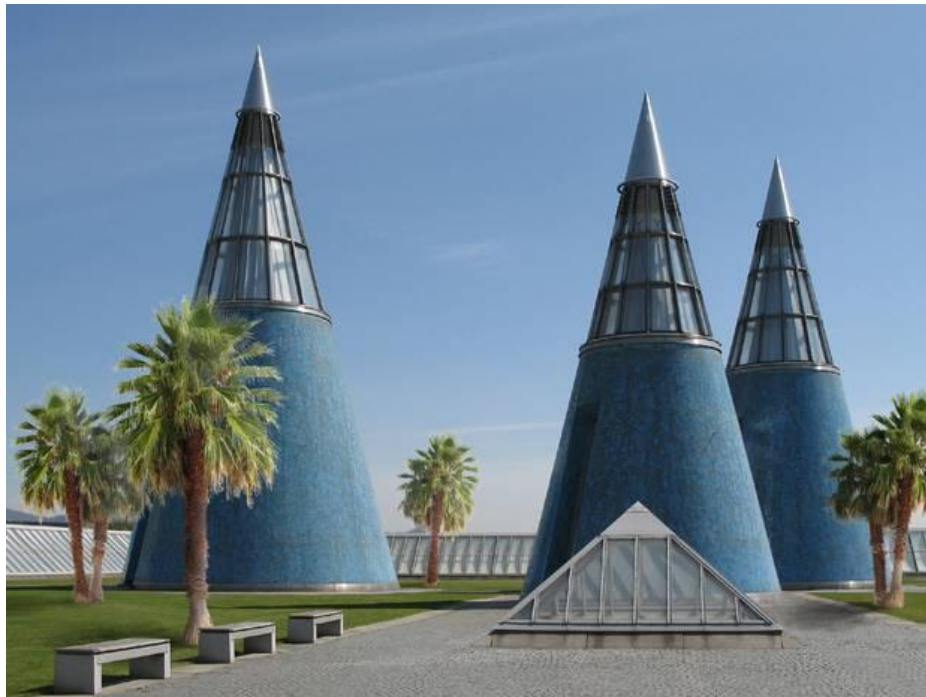
Αισθητικές παρεμβάσεις και δράσεις πάνω στην οροφή του Kunstmuseum Bonn – Γερμανία.

Sagrada Família: Visualisation of the Finished Basilica https://www.youtube.com/watch?v=2963MHzP-IE