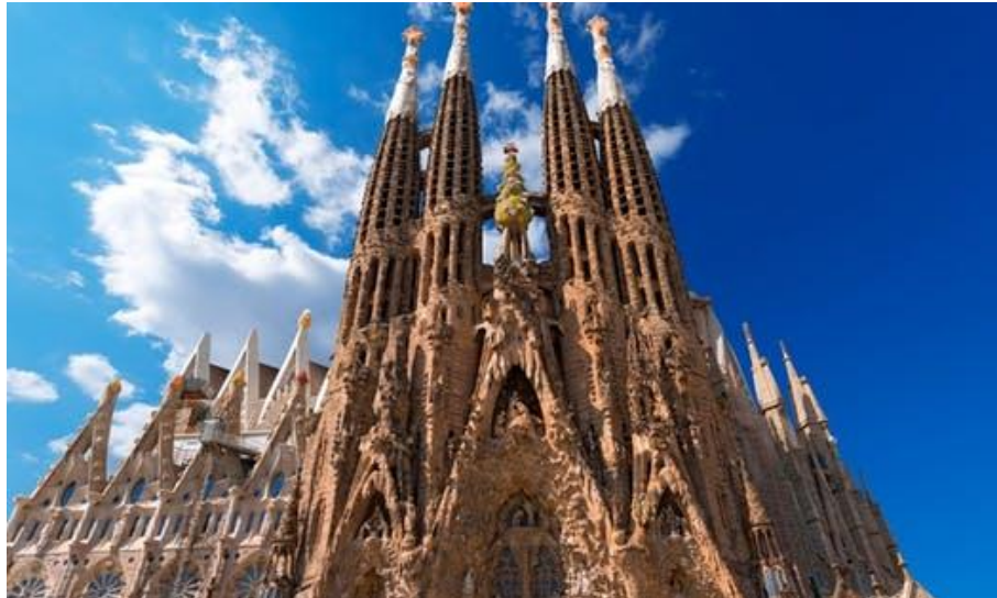
Sagrada Família – Βαρκελώνη – Ισπανία - Αρχιτ. Antoni Gaudí

Sagrada Família: Visualisation of the Finished Basilica https://www.youtube.com/watch?v=2963MHzP-IE