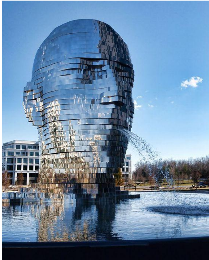
sculptor David Černý – Metalmorphosis Mirror Fountain – North Carolina USA