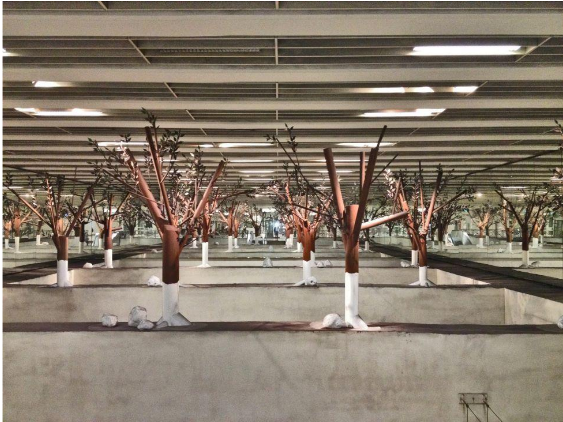
Στ. Εθνικής Άμυνας "Underground Park" Κωστας Τσόκλης