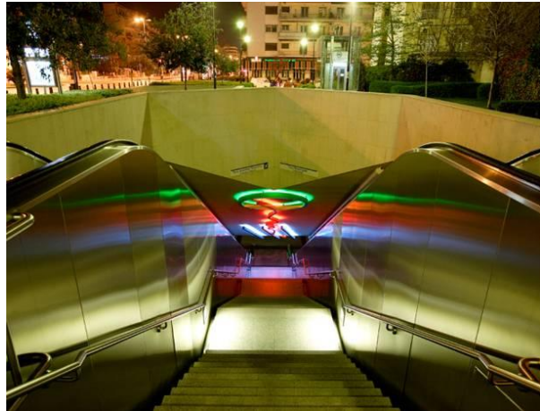
στ. Αμπελόκηποι - «Πομπή (Procession)» - Stephen Antonakos