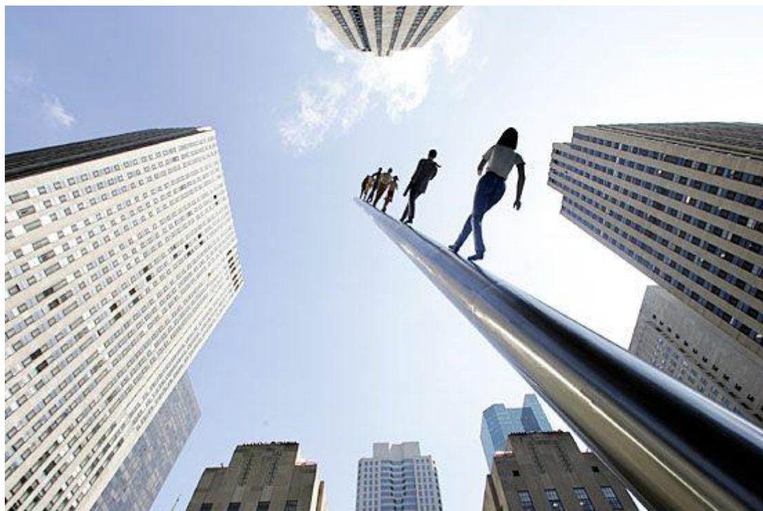
Walking to the Sky (2004) - Jonathan Borofsky - Nasher Sculpture Center, Dallas, Texas