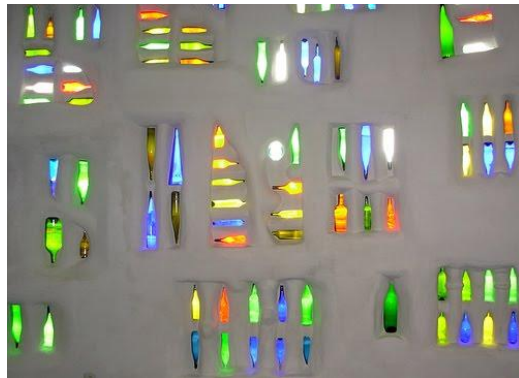
Φωτισμός εσωτερικού χώρου με μπουκάλια.