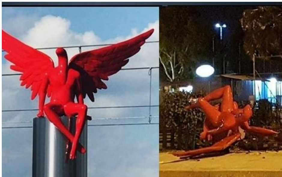
Το γλυπτό Phylax του Κωστή Γεωργίου, που είχε στηθεί στο Παλαιό Φάληρο, «κατέβασε» με το έτσι θέλω ομάδα κουκουλοφόρων.

Η δημόσια τέχνη είναι μια έννοια που βρίσκεται σε διαρκή αναθεώρηση, ακολουθώντας τις εξελίξεις και τις μεταμορφώσεις των δημόσιων χώρων της σύγχρονης μεγαλούπολης.