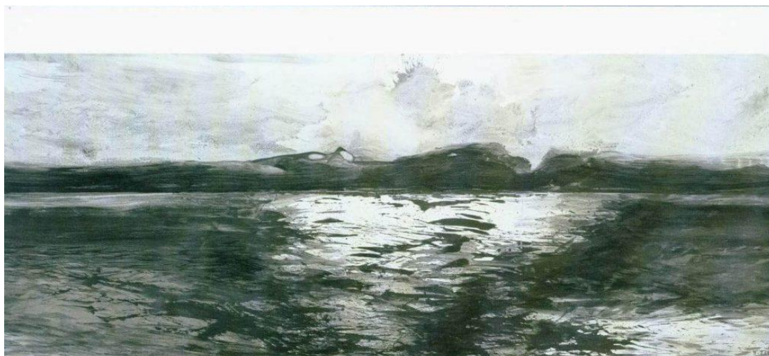
Π. Τέτσος ΖΩΓΡΑΦΙΚΗ

http://theglasshouse.org/media/architecture-is-a-game-using-light-to-reveal-the-shapes/