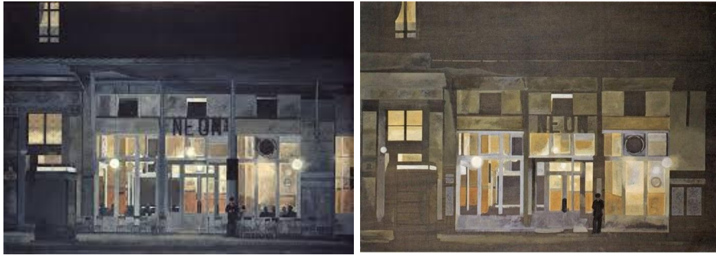
το Καφεενείον «NEON» ζωγραφισμένο με διαφορετικούς φωτισμούς από τον Γ. Τσαρούχη.

Η υφή των υλικών αλλά και τα χρώματα πρέπει να επιλέγονται με προσοχή, έτσι ώστε «η λάμψη τους να ξεθωιάζει με το πέρασμα του χρόνου» και πάνω τους να διακρίνεις «την πατίνα του χρόνου που με τόσους κόπους έχει εναποθέσει ο χρόνος» • αυτό πρέπει να έχουμε κατά νου, όπως σοφά μάς υποδεικνυε ο Ιάπωνας συγγραφέας Τανιζάκι στο βιβλίο του «Εγκώμιο της Σκιάς». Επιφάνειες στιλπνές και αστραφτερές μετατρέπονται εύκολα σε καθρέφτες που αντανακλούν έντονα τις ηλιακές ακτίνες, σε αντίθεση με τις πιο αδρές που τις απορροφούν διαχέοντας το φως. Είναι κάτι που αντιλαμβανόμαστε, όταν ατενίζουμε την πόλη από ψηλά και ανάλογα με την κίνηση του ήλιου πολλές επιφάνειες εκτεταμένων υαλοπετασμάτων ή ηλιακών συλλεκτών, η μία μετά την άλλη, λαμπυρίζουν έντονα και μας τυφλώνουν όσο μακριά κι αν βρίσκονται. Μετατρέπονται έτσι σε διαδοχικές στιγμιαίες εστίες φωτός που λειτουργούν σαν δυνατοί προβολείς κατά τη διάρκεια της ημέρας. Ένα χαρακτηριστικό που το γνωρίζουν ακόμη και τα μικρά παιδιά, στα νησιά για παράδειγμα, παίζοντας με καθρέφτες, σημαδεύουν από τα σπίτια τους, που βρίσκονται ψηλά στο βουνό, ως καλωσόρισμα το πλοίο που καταφτάνει μετά το πολύωρο ταξίδι στο λιμάνι.