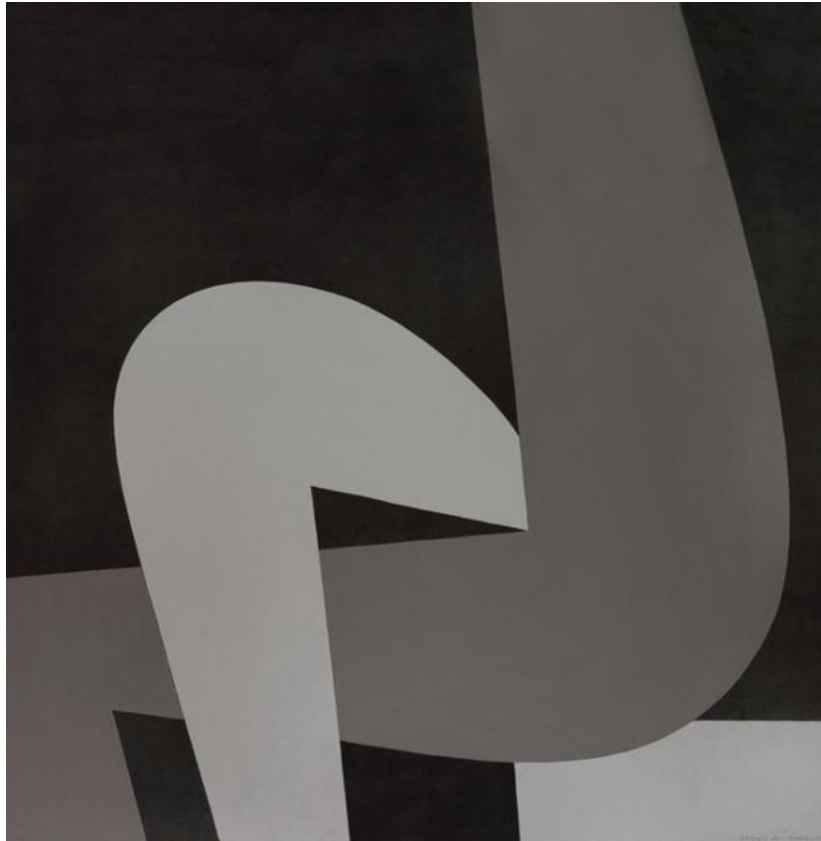
M/A ζωγραφικό έργο του Γιάννη Μόραλη.

Δεν πρέπει να λησμονούμε ότι το φως δίνει την κλίμακα του χρόνου στο χώρο. Ο εσωτερικός χώρος, για παράδειγμα, αποκτά τελείως διαφορετικά ποιοτικά χαρακτηριστικά όταν το φως εισέρχεται από πάνω, από το πλάι ή από κάτω ή πάλι όταν διεισδύει από μια σχισμή ή ένα μεγάλο άνοιγμα. Στις εξωτερικές όψεις κατά τη διάρκεια της ημέρας οι τοίχοι είναι φωτεινοί, ενώ τα ανοίγματα και τα υαλοστάσια πάνω στις επιφάνειες είναι σκοτεινά και δύσκολα μπορείς να διακρίνεις το εσωτερικό του κτηρίου. Εκείνες τις ώρες ακυρώνεται η διαφάνεια των κρυστάλλων. Αντίθετα, καθώς πέφτει η νύχτα οι τοίχοι σιγά-σιγά γκριζάρουν και στο τέλος σκοτεινιάζουν εντελώς και χάνονται μέσα στο σκοτάδι, ενώ τα ανοίγματα τώρα φωτίζονται αποκαλύπτοντας στον περαστικό τον εσωτερικό χώρο, αφού η φωτεινή πηγή βρίσκεται μέσα στο κτήριο. Η αντιστροφή αυτή φωτός-σκιάς κατά τη διάρκεια της νύχτας αποτελεί σημαντική συνθετική συνιστώσα της αρχιτεκτονικής.