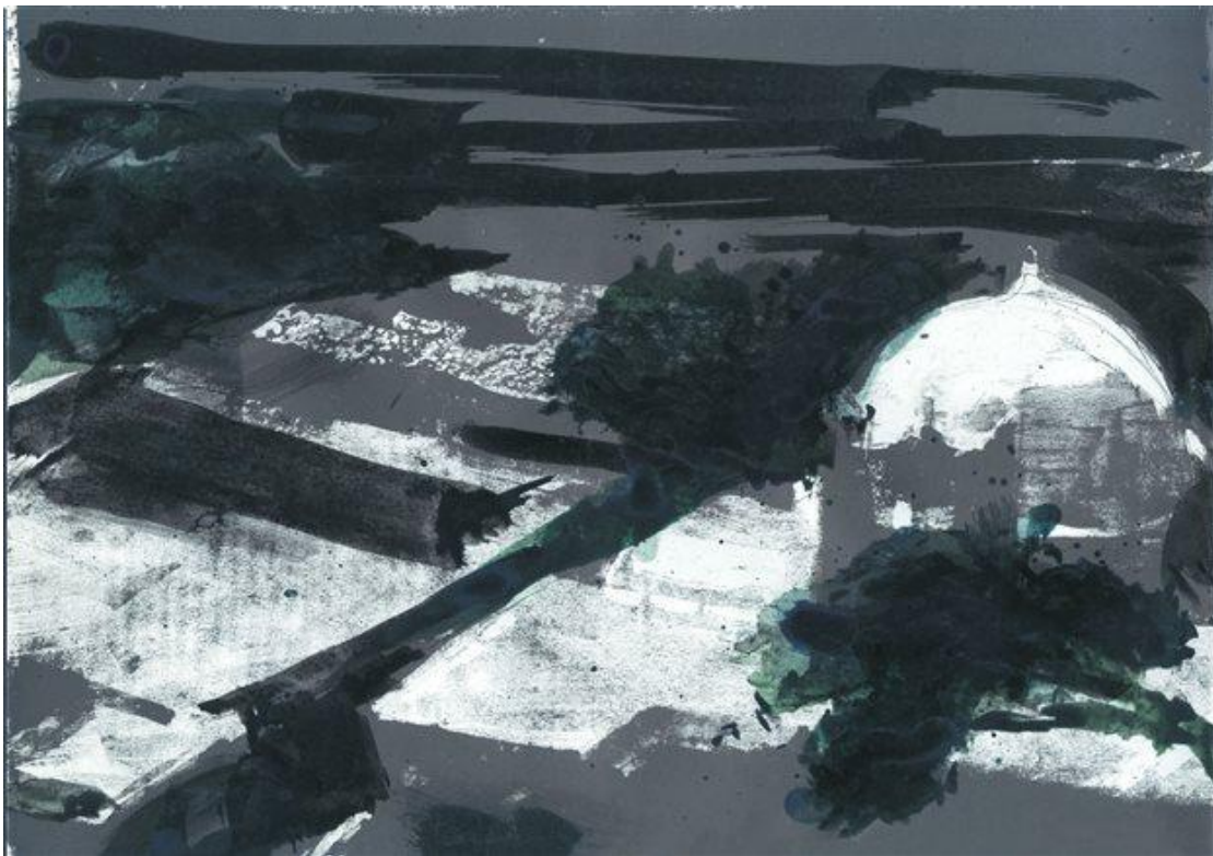
Ζωγραφικό έργο του Παναγιώτη Τέτση.

email takiskozokos@gmail.com web www.takiskozokos.gr