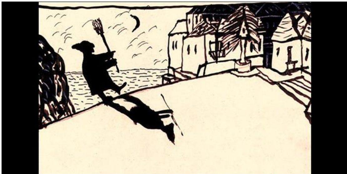
«Σκιές» ζωγραφικό έργο του Νίκου Χουλιαρά.

Η υφή των υλικών αλλά και τα χρώματα πρέπει να επιλέγονται με προσοχή, έτσι ώστε «η λάμψη τους να ξεθωιάζει με το πέρασμα του χρόνου» και πάνω τους να διακρίνεις «την πατίνα του χρόνου που με τόσους κόπους έχει εναποθέσει ο χρόνος» • αυτό πρέπει να έχουμε κατά νου, όπως σοφά μάς υποδεικνυε ο Ιάπωνας συγγραφέας Τανιζάκι στο βιβλίο του «Εγκώμιο της Σκιάς». Επιφάνειες στιλπνές και αστραφτερές μετατρέπονται εύκολα σε καθρέφτες που αντανακλούν έντονα τις ηλιακές ακτίνες, σε αντίθεση με τις πιο αδρές που τις απορροφούν διαχέοντας το φως. Είναι κάτι που αντιλαμβανόμαστε, όταν ατενίζουμε την πόλη από ψηλά και ανάλογα με την κίνηση του ήλιου πολλές επιφάνειες εκτεταμένων υαλοπετασμάτων ή ηλιακών συλλεκτών, η μία μετά την άλλη, λαμπυρίζουν έντονα και μας τυφλώνουν όσο μακριά κι αν βρίσκονται. Μετατρέπονται έτσι σε διαδοχικές στιγμιαίες εστίες φωτός που λειτουργούν σαν δυνατοί προβολείς κατά τη διάρκεια της ημέρας. Ένα χαρακτηριστικό που το γνωρίζουν ακόμη και τα μικρά παιδιά, στα νησιά για παράδειγμα, παίζοντας με καθρέφτες, σημαδεύουν από τα σπίτια τους, που βρίσκονται ψηλά στο βουνό, ως καλωσόρισμα το πλοίο που καταφτάνει μετά το πολύωρο ταξίδι στο λιμάνι.