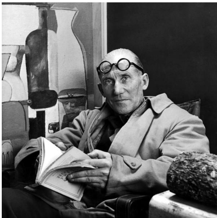
Le Corbusier: "Vers une Architecture", 1923

Και ο άνθρωπος νιώθει απέραντη ευτυχία, όταν αισθάνεται ότι δημιουργεί."