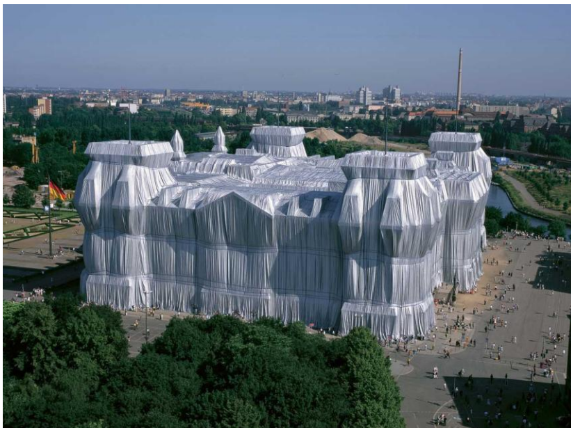
Christo and Jeanne Claude – Wrapped Reichstag 1995

Ως έργο ανθρώπου, η δημόσια τέχνη αποτελεί μέρος της έκφρασης του πολιτισμού της εκάστοτε κοινωνίας, αποδίδοντας στο αστικό τοπίο την πολιτισμική του ταυτότητα.