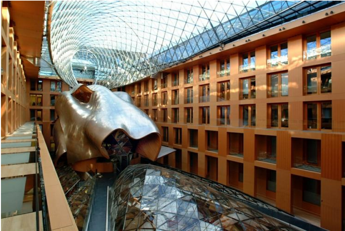
Frank O. Gehry - DZ Bank building – Berlin