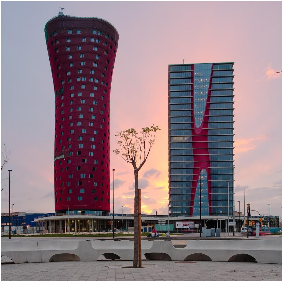
Architekt Toyo Ito - Hotel Porta Fira - Barcelona