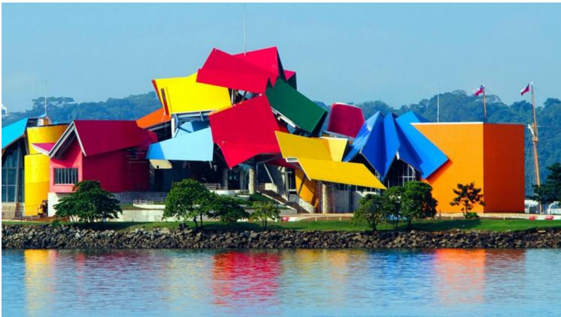
Frank O. Gehry- BioMuseo - Panama City