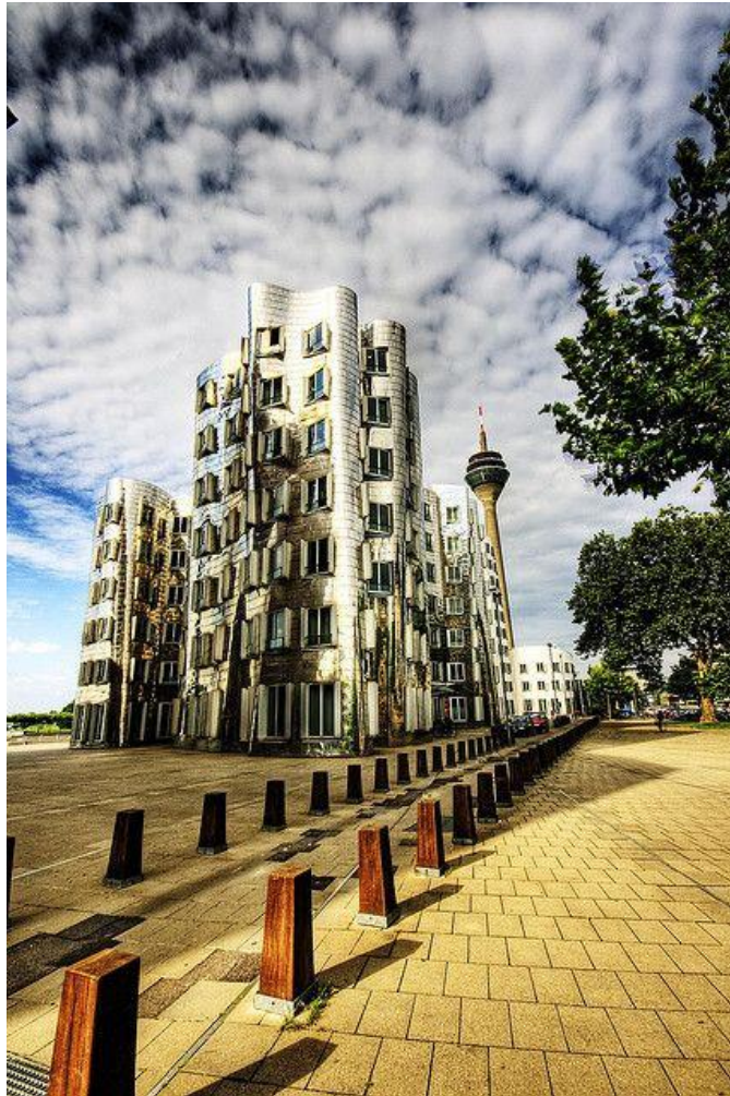
Frank O. Gehry - Neuer Zollhof Düsseldorf