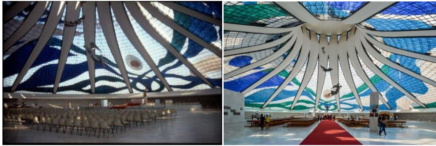
Catedral Metropolitana: The Metropolitan Cathedral of Brasilia by architect Oscar Niemeyer