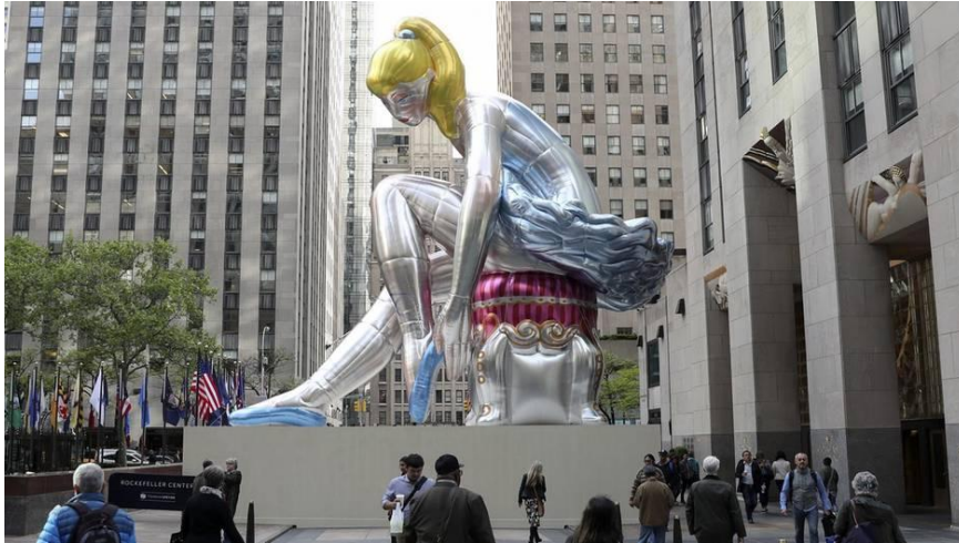
Jeff Koons - New York – Ballerina 2017