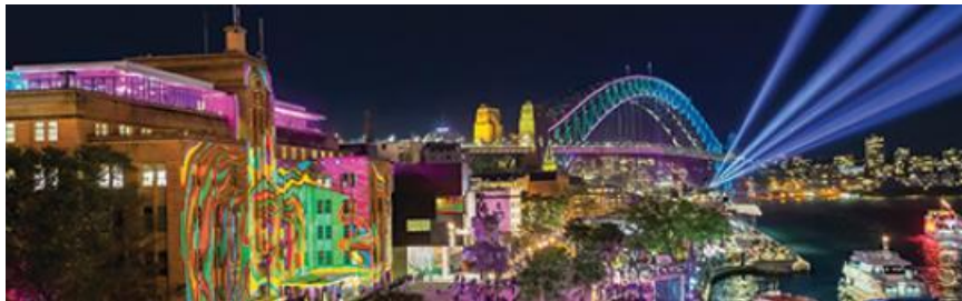
Vivid Sydney Timelapse