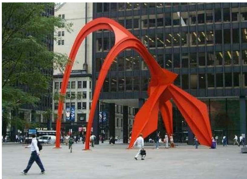
Flamingo by A. Calder - Chicago – 1974