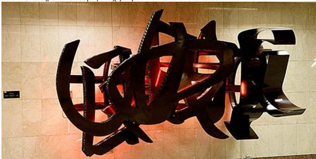
Στ. Ευαγγελισμός «Mott Street» Καλλιτέχνης: Χρύσα