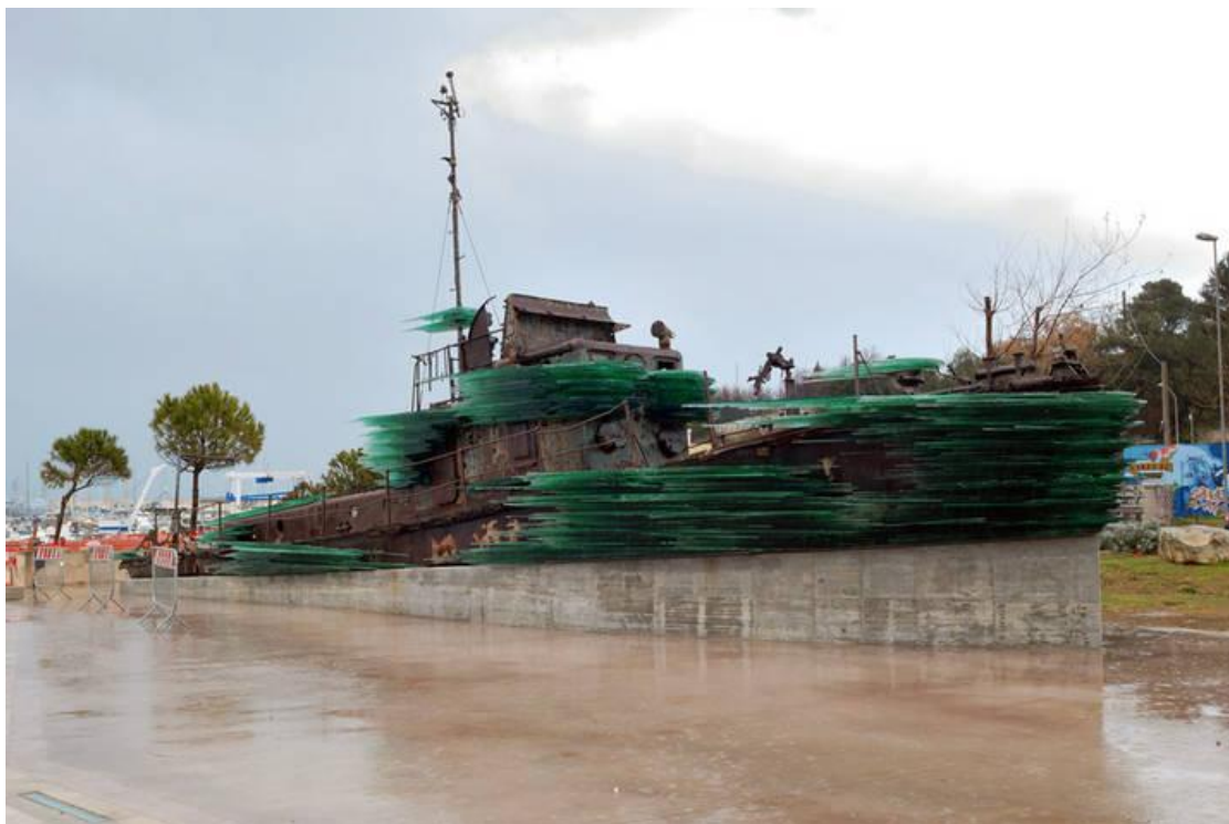
ΚΩΣΤΑΣ ΒΑΡΩΤΣΟΣ: "Η ΕΛΛΑΔΑ ΕΙΝΑΙ ΜΙΑ ΓΥΝΑΙΚΑ ΠΟΥ ΒΙΑΖΕΤΑΙ ΜΑΖΙΚΑ" https://www.youtube.com/watch?v=lsvebQO3PTU