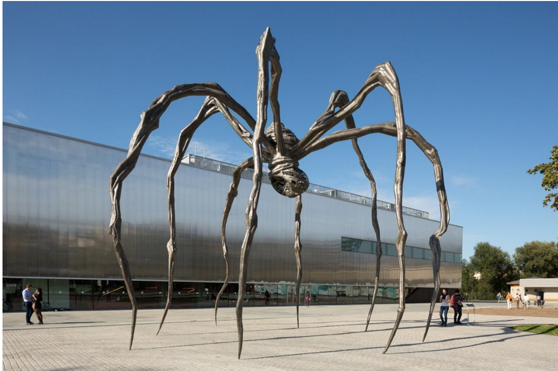
Louis Bourgeois's "Maman" (1999) - Garage Museum of Contemporary Art –Moscow.