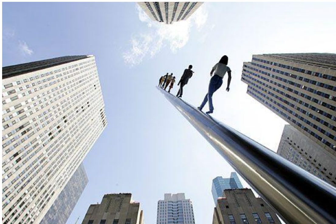
Walking to the Sky (2004) - Jonathan Borofsky - Nasher Sculpture Center, Dallas, Texas