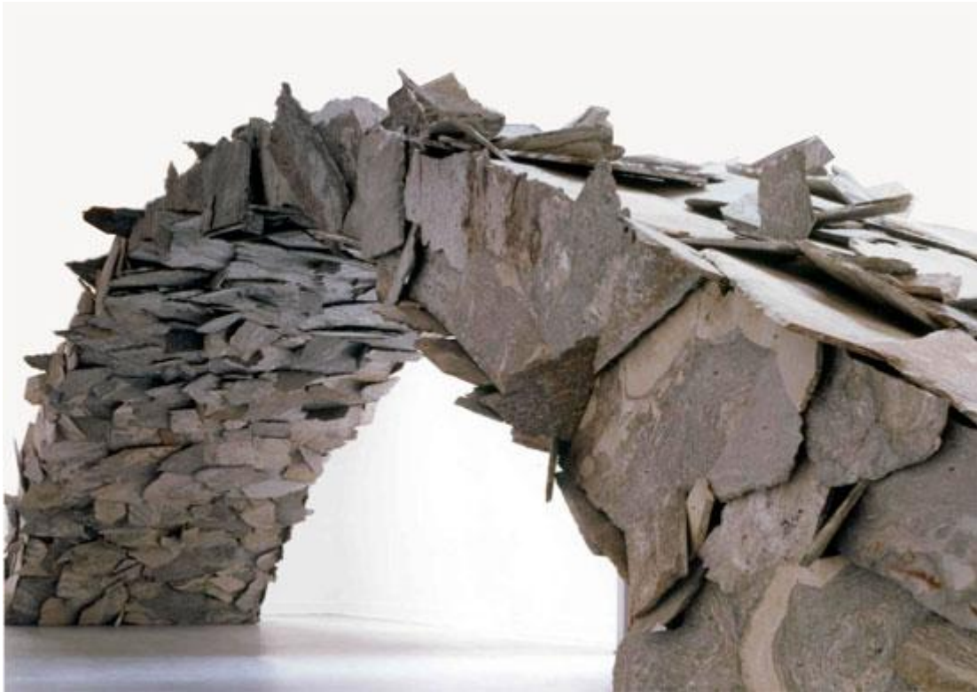
Συνάντηση : Κώστας Βαρώτσος (06/05/2017) https://www.youtube.com/watch?v=9egplwDjYyQ&feature=share