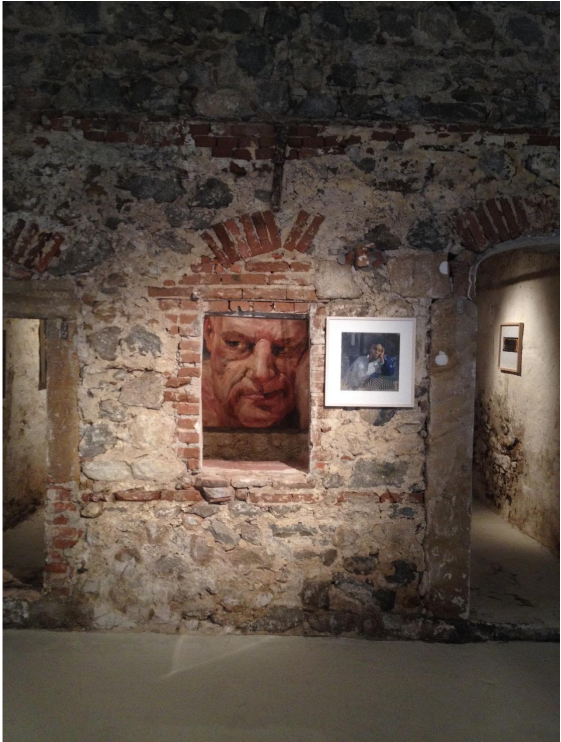
από την πόλη οθόνη στην πόλη σκηνή Ξάνθη: Πόλη ζωντανή με αισθητική και άποψη ...(?)