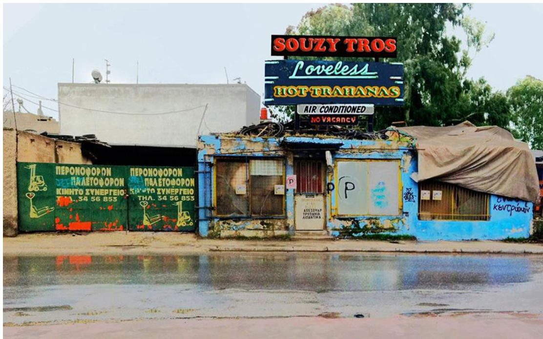
ΤΑΜΑ 1998 – Μαρία Παπαδημητρίου Το έργο της Μ.Π. περιστρέφεται γύρω από τις έννοιες της παρωδίας, του παράδοξου και της προσωπικής ταυτότητας.