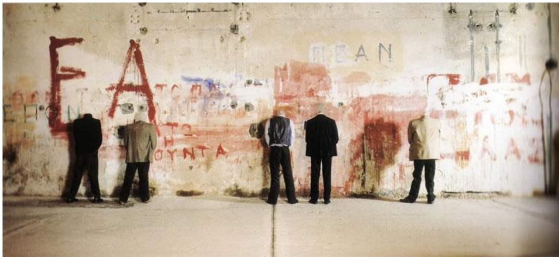
Βλάσης Κανιάρης, Ουρητήρια της Ιστορίας, 1980, installation, Fix , Athens