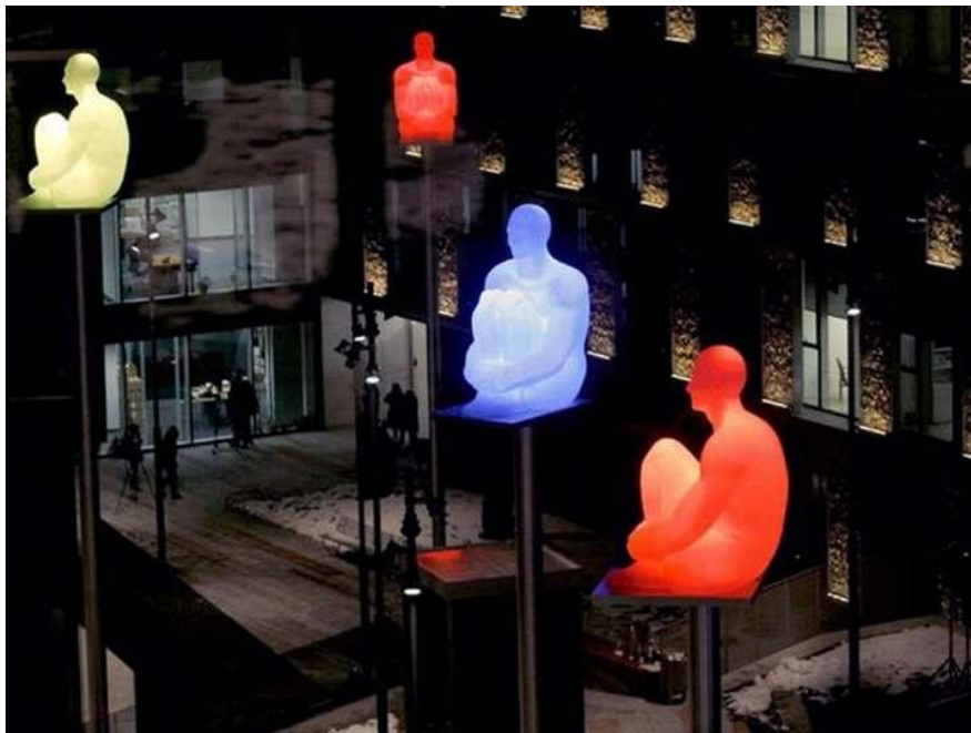
Jaume Plensa 7 Poets Plaa Lidia Armengol Vila Andora 2014

“Η δημόσια τέχνη δεν έχει στόχο τη διακόσμηση, την τέρψη ή την αναψυχή. Είναι μια μορφή τέχνης που εξελίσσεται ταυτόχρονα με τους μετασχηματισμούς της αστικής ζωής και την ανταπόκριση των καλλιτεχνών στους μετασχηματισμούς αυτούς. Στο έργο της δημόσιας τέχνης διασταυρώνονται η αισθητική, η δημόσια ζωή, ο κοινωνικός πλουραλισμός και ο πολιτικός ακτιβισμός.