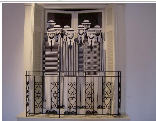
Γιάννης Γαϊτης, Χωρίς τίτλο, 1977, εγκατάσταση, κατασκευή από ζωγραφισμένο ξύλο