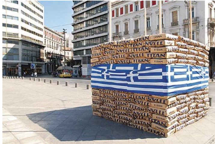
Εις Δόξαν. Το εμβληματικό έργο του Βλάση Κανιάρη από τη συλλογή του ΕΜΣΤ που είχε τοποθετηθεί στην Ομόνοια το 2011