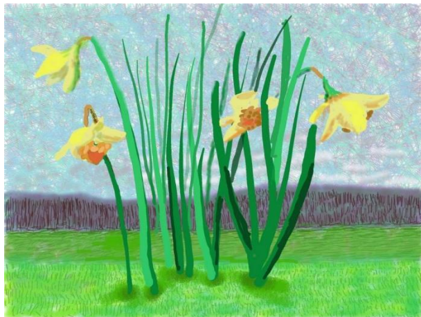
"Do remember they can't cancel the spring." David Hockney