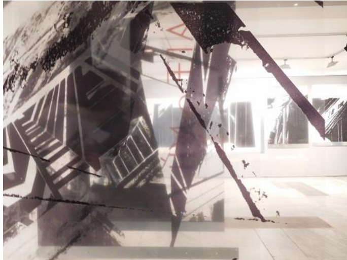
Από τα Χαρακτικά στα Κατοικημένα Γλυπτά Τοπία