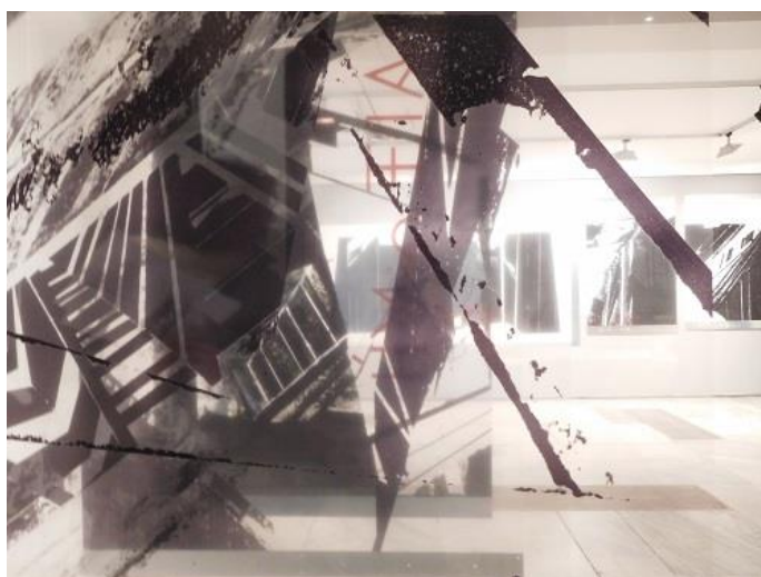
Από τα Χαρακτικά στα Κατοικημένα Γλυπτά Τοπία