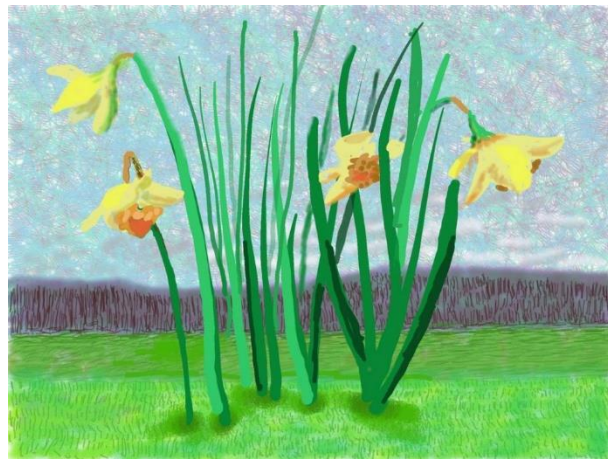
“Do remember they can’t cancel the spring.” David Hockney