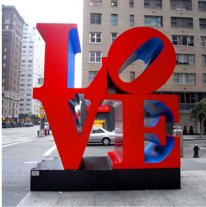
Love Sculpture – Manhattan NY 2006

Σύμφωνα με μια σειρά κοινωνικών και αρχιτεκτονικών μελετών αλλά και βάσει αστικών παρεμβάσεων που έλαβαν χώρα στην Αμερική και τον ευρωπαϊκό βορά, αρκούν τρία πράγματα για να ξαναζωντανέψει ο δρόμος: