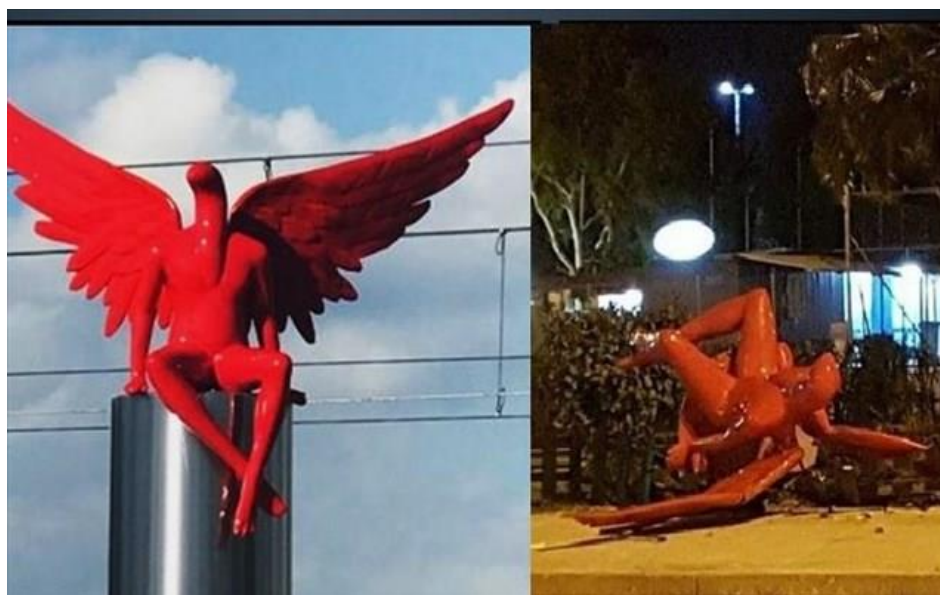
Το γλυπτό Phylax του Κωστή Γεωργίου, που είχε στηθεί στο Παλαιό Φάληρο, «κατέβασε» με το έτσι θέλω ομάδα κουκουλοφόρων.

Η δημόσια τέχνη είναι μια έννοια που βρίσκεται σε διαρκή αναθεώρηση, ακολουθώντας τις εξελίξεις και τις μεταμορφώσεις των δημόσιων χώρων της σύγχρονης μεγαλούπολης.