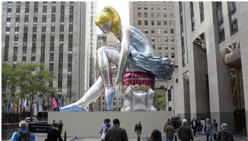
Jeff Koons - New York – Ballerina 2017

https://www.youtube.com/watch?v=9zWd-M8EwmM&ab_channel=AssociatedPress