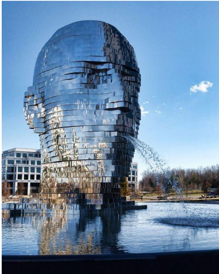
sculptor David Černý – Metalmorphosis Mirror Fountain – North Carolina USA