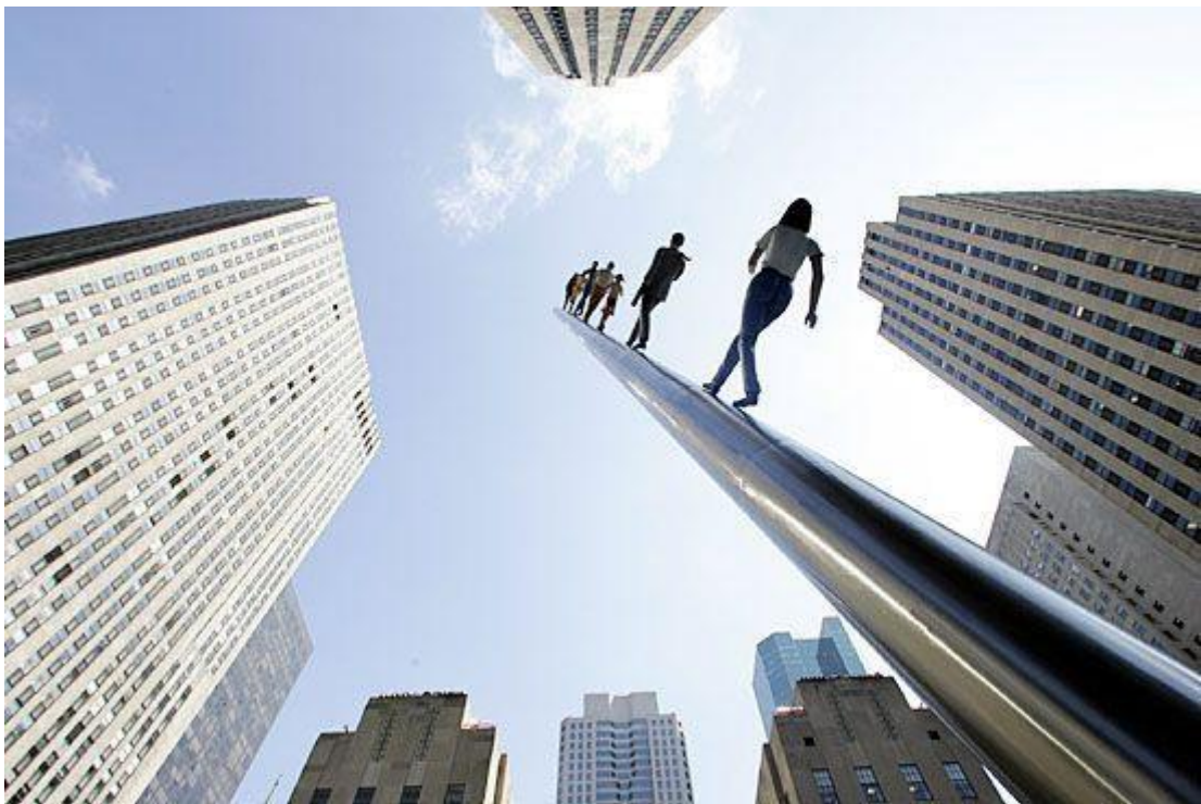
Walking to the Sky (2004) - Jonathan Borofsky - Nasher Sculpture Center, Dallas, Texas