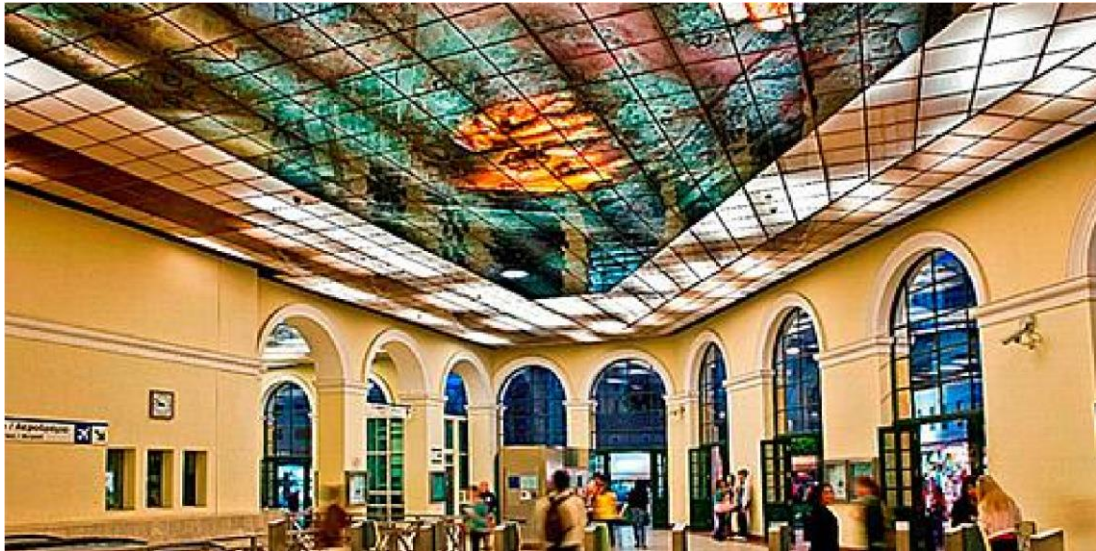
στ. Μοναστηράκι «Ο κόσμος στα χέρια μου» Λ. Παπακωνσταντίνου