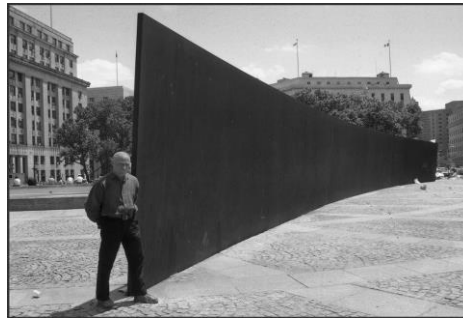
«Tilted Arc» του Richard Serra (1971)