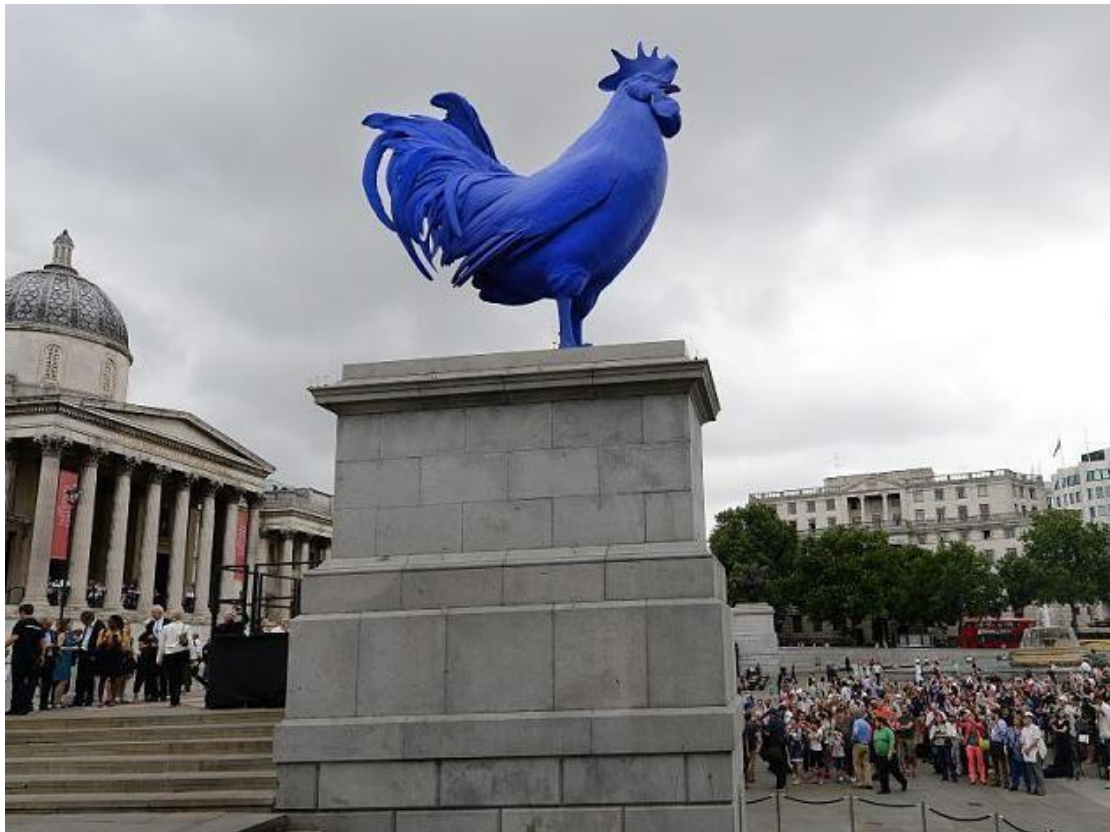
Created by Katharina Fritsch, 'Hahn/Cock'

Η τέταρτη κολόνα του Νέλσονα στην πλατεία Trafalgar “στολίζεται” με ένα διαφορετικό έργο τέχνης από το 1998 και έπειτα. Τα έργα έχουν φιλοτεχνήσει σημαντικοί καλλιτέχνες όπως οι Rachel Whiteread, Yinka Shonibare, Mark Wallinger και Antony Gormley.