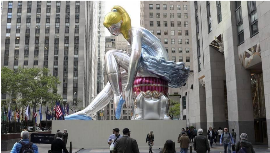
Jeff Koons - New York – Ballerina 2017

https://www.youtube.com/watch?v=9zWd-M8EwmM&ab_channel=AssociatedPress