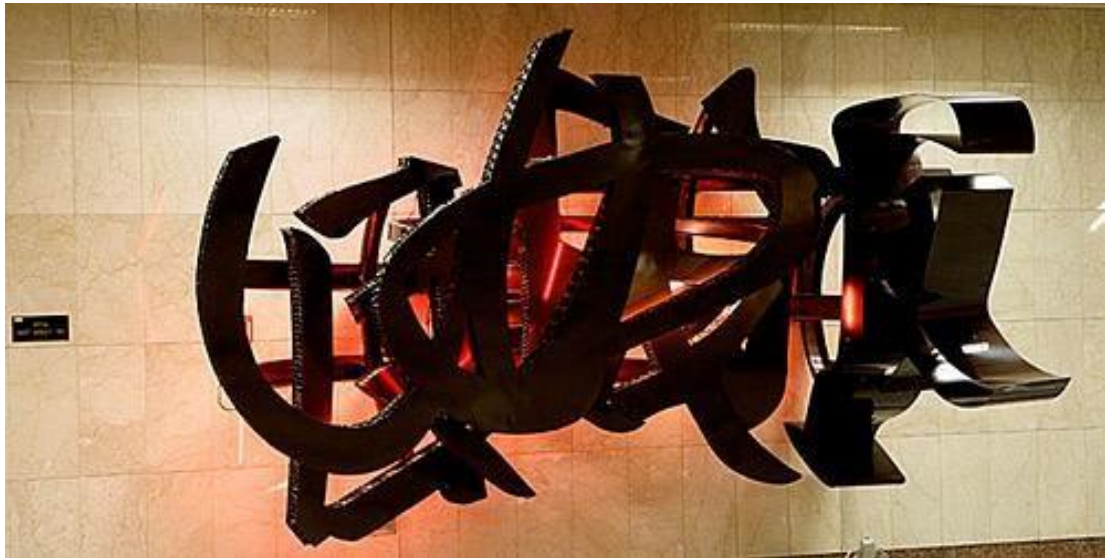
Στ. Ευαγγελισμός «Mott Street» Καλλιτέχνης: Χρύσα