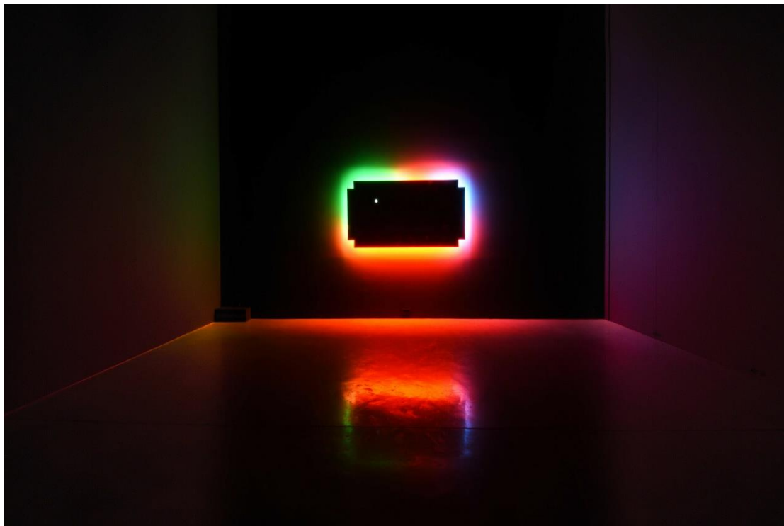
Stephen Antonakos, «Άγιος Ιωάννης ο Βαπτιστής» (1992), οξειδωμένος σίδηρος και φώτα νέον