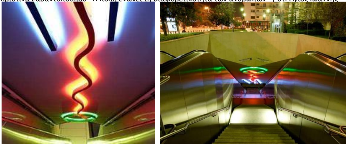
στ. Αμπελόκηποι - «Πομπή (Procession)» - Stephen Antonakos