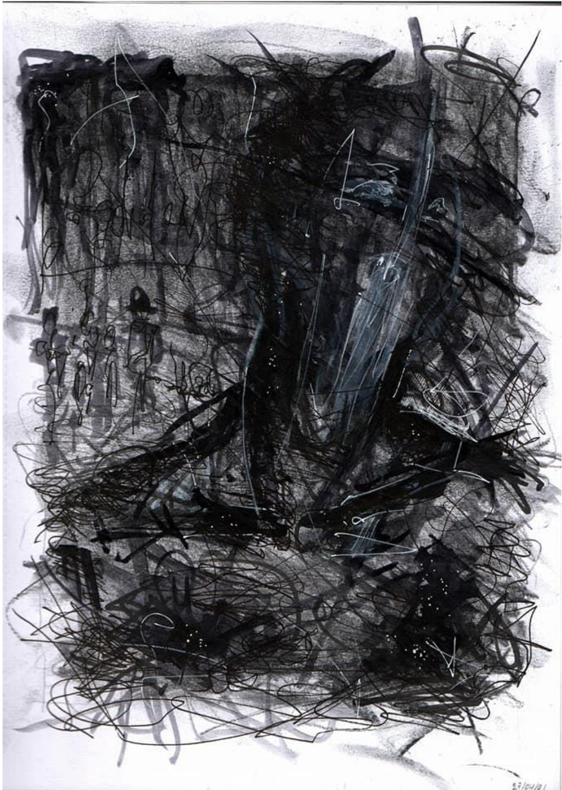
Παράδειγμα Θέμα: 3 ο Σκοτάδι και Φως με μικτές τεχνικές