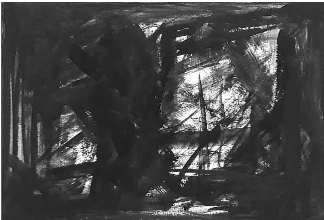
Παράδειγμα Θέμα: 3 ο Σκοτάδι και Φως με τέμπερα