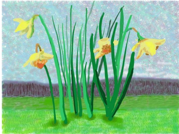
“Do remember they can’t cancel the spring.” David Hockney